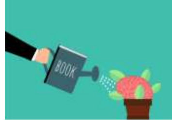
புத்தக வாசிப்பும் கற்றலும்